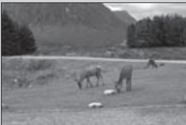
Door Schotland (2)