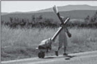
Op de Camino (2)