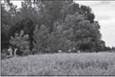
Nieuwe Rooise routebouwers

CLUBBLAD VAN WSV OLAT • JAARGANG 37 • NUMMER 1 • JANUARI 2010